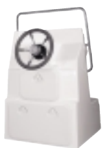
BTA-C48B konzola LX (470-650)