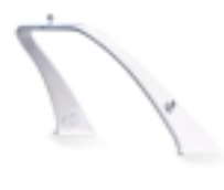
BTA-S60 Roll-bar X-celence