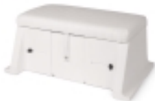
BTA-B03 Sedačka s odkládacím prostorem a nastavitelnou šířkou (dle člunu)