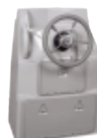
BTA-C73 konzola LX „Scuba“