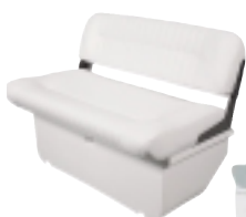
BTA-C99 Sedačka pro čluny 400+430