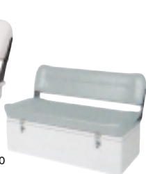
Sedačka s odkládacím prostorem pro „Scuba / X-Scuba“