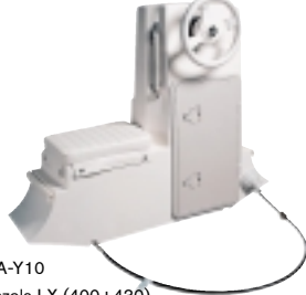
BTA-Y10 konzola LX (400+430)