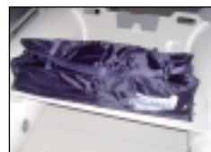
BTA-R 42 taška, kterou je možné připevnit pod sedátko člunu