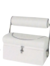
Sedačka s odkládacím prostorem pro řadu „Top line“