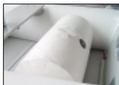
BTA-R10 nafukovací válec (místo sedátka)