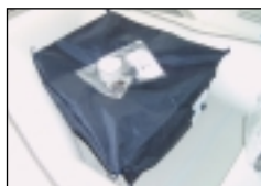
BTA-R32 taška na přední člunu+držáky+lepidlo

Malé čluny Arimar vždy koupíte bez tašky do špičky člunu, tašky pod sedátko a bez sedátek, která mohou být pevná na držácích - lavička, nebo nafukovací - válec. Je to z toho důvodu, že výrobce Vám dává šanci dovybavit si člun přesně podle Vašich přání nadstandardní výbavou, kterou nemusíte platit v základním vyhotovení člunu i v případě, že jí nebudete potřebovat. Navíc je možné sedátka (nebo i více sedátek) umístit libovolně dle Vaší potřeby!