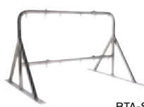
BTA-S42a Držák potápěčských lahví