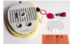
Každý člun je vybaven sadou lepení a nožní pumpou