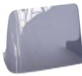
BTA-S04 Přední plexisklo pro X-celence