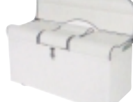
Sedačka s odkládacím prostorem pro řadu „X-Pioneer 580“