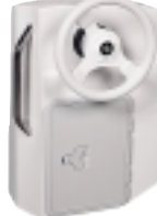
BTA-C60 konzola Tender