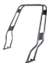
BTA-S05 Roll-bar pro 470+500+540