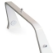
BTA-S60 Roll-bar 580-650