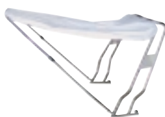
teleskopická sluneční střeška pro 400/430/470+500+540