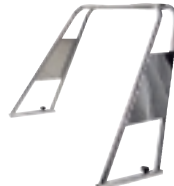
BTA-S78 Roll-bar pro 580+650