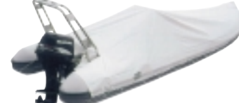
BTA-dle typu člunu persening - plachta pro zakrytí člunu