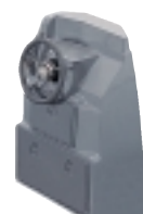
BTA-X-690 konzola řízení