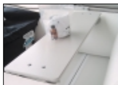
BTA-R24 pevné sedátko+2 držáky+lepidlo