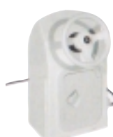
konzola řízení pro řadu „Top line“