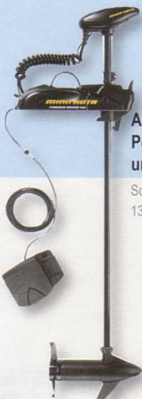
AP/US2-Modelle PowerDrive V2 und Terrova

Durch Verwendung eines als Zubehör erhältlichen Adapters können Sie Ihren Minn Kota Universal Sonar Elektroaußenborder an einen Fishfinder Ihrer Wahl anschließen, ohne sich über freiliegende Leitungen oder Sonar-Störungen zu sorgen (192/200 kHz). Einfach anstecken und Sie sind unterwegs zum Fisch.