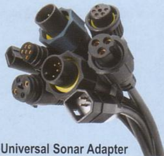
Universal Sonar Adapter

Für Powerdrive Universal Sonar bis BJ 2006