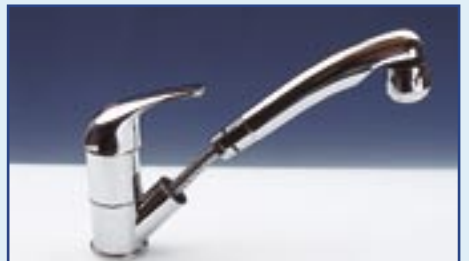
Einhebelmischer mit Kombibrause

Einhebelmischer „KERAMIK“ die erprobte Keramik-Kartusche - in Messing gefasst - bürgt für beständige Qualität. Durch die Feinregulierung der Temperatur und Durchflussmenge äusserst sparsam im Wasserverbrauch. Mit Mikroschalter. Entleerungsanzeige.