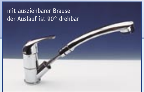
Einhebelmischer mit Brause „DUETT“

mit ausziehbarer Brause der Auslauf ist 90° drehbar