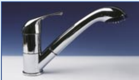
Einhebelmischer mit Brause „JULIA“

260 g Montagebohrung 33 mm 300/690 49,50 890 g Montagebohrung 36 mm 300/691 74,90 890 g mit Schalter 300/686 85,95 890 g ohne Schalter 300/687 84,95 890 g Montagebohrung 36 mm 300/692 78,90 890 g Montagebohrung 33 mm 300/693 48,90 260 g Montagebohrung 33 mm 300/694 64,50